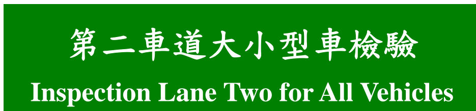
圖 11：檢驗車道標示牌