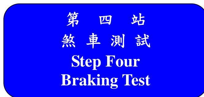
圖 15：煞車測試標示牌