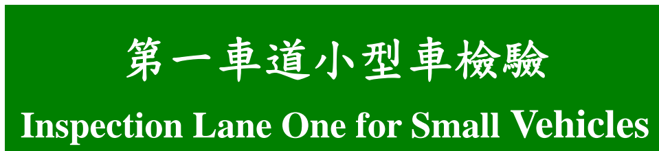
圖 10：檢驗車道標示牌