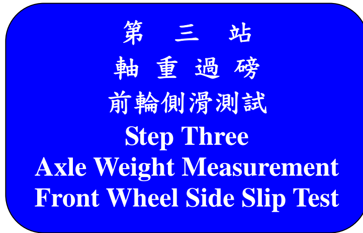
圖 14：軸重過磅、前輪側滑測試標示牌