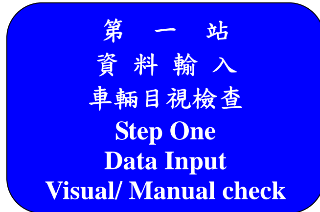
圖 12：一般外觀檢驗標示牌