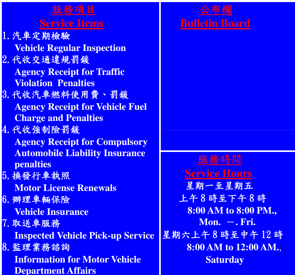
圖 2：服務項目與服務時間標示牌