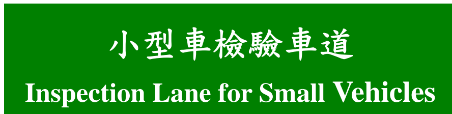
圖 9：檢驗車道標示牌