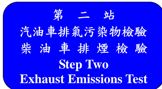
圖 13：排氣測試標示牌