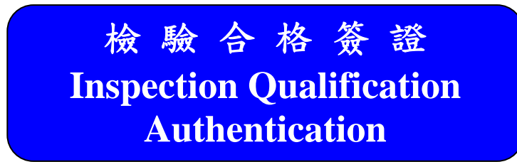
圖 16：檢驗合格簽證標示牌