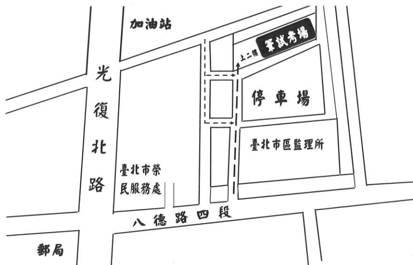
臺北市區監理所約僱人員 筆試考場位置圖